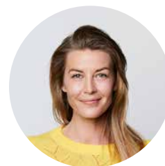
Navn Navnesen Kort om bidragsyteren til arrangementet.