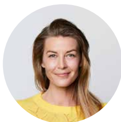
Navn Navnesen Kort om bidragsyteren til arrangementet.