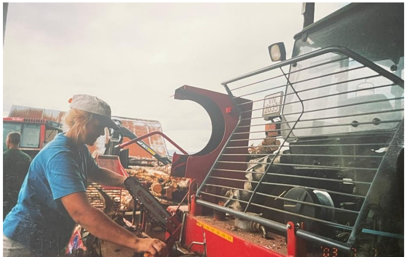
Figur 10 og 11: bestemors sommer jobb som et jordbær plukker og vedproduksjon