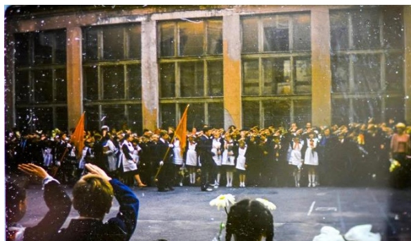
Bilde 3: Skole start før SU fall.

Ifølge bestemoren min startet hver skoledag med elever fra ulike klasser som dannet rekker på skolegården (Navickiene, 2023). Hun fortalte at de måtte stå pent, og den flinkeste eleven ble valgt til å lede klassene i rekker foran skoleledelsen. Alle bar uniformer med et rødt skjerf rundt halsen og en rød lue. Barna ble opplært i sosialistisk ideologi fordi de ble betraktet som håpet for en kommunistisk fremtid (Navickiene, 2023). Derfor var det viktig å ha faste felles rutiner slik at barna ikke utviklet individuelle og kritiske tanker, men heller ble lojale mot det som ble ansett som mest rettferdige og avanserte Sovjetunionen (Rouge, 2020)