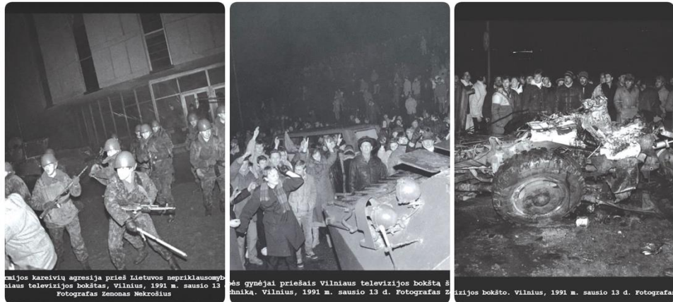
Bilde 6: Den blodige søndagen 13.01.1991

Den andre hendelsen som førte til Litauens' uavhengighet, var den 13. Januar 1991. Denne dagen ble kjent som den Blodige søndagen, da sovjetiske styrker forsøkte å undertrykke Litauens uavhengighetsbevegelse (NRK, 2001). Tusenvis av litauere samlet seg rundt landets radiostasjon i