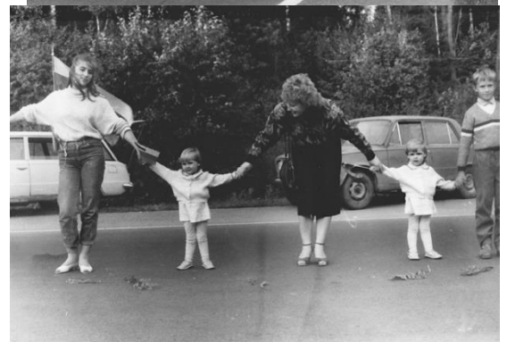
Bilde 5: Fra bestemoren sin fortid Menneskekjeden, 23.08.1989