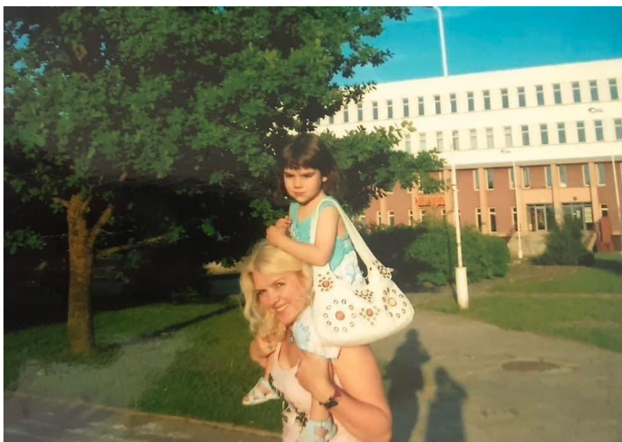
Bilde 1: Bilde av meg og bestemor fra 2007, Siaulai

I hvilken grad ble livet til bestemor bedre etter Sovjetunionens fall?