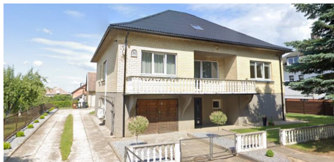
Bilde 9: Bilde av bestemors hus.

isolert. Som bestemoren pleide å si: "Det hadde to murvegger – den ytre og den innerste, og mellomrommet var tomt. Dessuten ble huset oppvarmet ved hjelp av gass." Ifølge bestemoren min var utgiftene til huset så høye at lønnen ikke var nok til å dekke dem. Derfor var hun nødt til å reise, spesielt om sommeren, og etter hvert for lengre perioder, for å tjene penger til å dekke gjelden. Etter hardt arbeid i utlandet installerte hun sentralvarme, noe som betydde at hun kunne varme opp huset ved å brenne ved. I tillegg isolerte hun huset, og det har blitt mer bærekraftig.