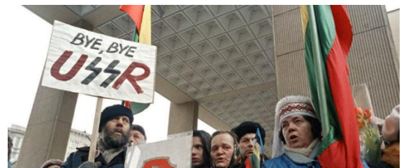
Bilde 4: det Litauiske folket protesterer for sin uavhengighet.

Før Sovjetunionens fall, med hjelp fra kollektivbruket klarte bestemoren og bestefaren å skaffe seg en tomt og bygge sitt eget hus med en stor hage. Deler av inntektene fra