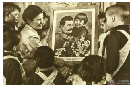
Bilde 2: Her lærer barna i barnehagen om Stalins liv

Barn ble fra en tidlig alder indoktrinert i barnehager, skoler og andre institusjoner med budskap om hvor snill Lenin var og hvor mye han elsket folket, osv. (Irytas, 2019). I tillegg var det betydelig fokus på Stalins liv for å forme barn til tilhengere av kommunismen (Irytas, 2019).