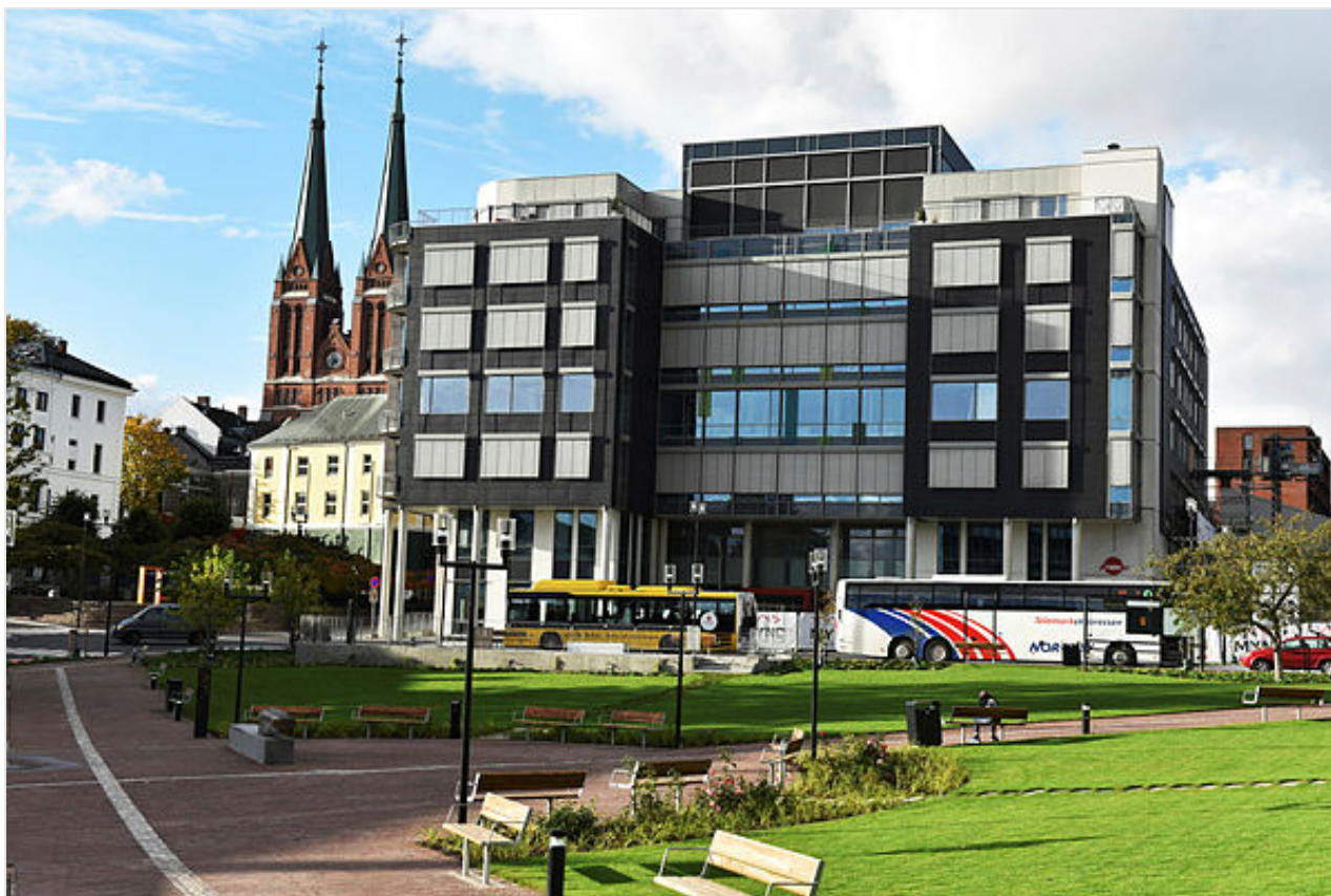
Figur 3 Telemarkshuset i Skien sentrum

Telemark fylkeskommune er deltager eller har eierinteresser i til sammen 28 virksomheter: aksjeselskap, interkommunale selskap, samvirkeforetak, kommunale oppgavefelleskap og særlovselskap.