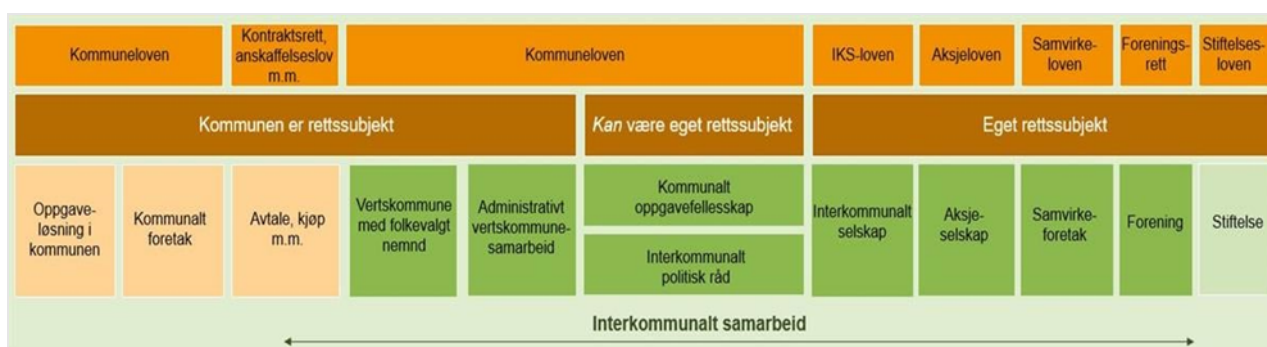
Figur 2 Oslo Economics, bearbejdet av Kommunal- og distriktsdepartementet

Figur 2 under gir en oversikt over ulike måter kommuner kan løse oppgaver på. I figuren er lovfestete former for interkommunalt samarbeid markert med grønt.